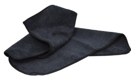
SOFTY FIBER WHOW0010