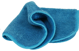
WAXY FIBER + WHOW0014